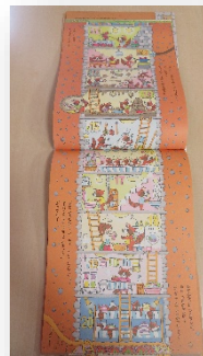
縦開きの絵本です